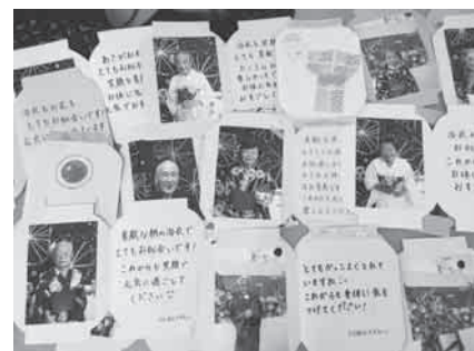
メッセージカードを作りました