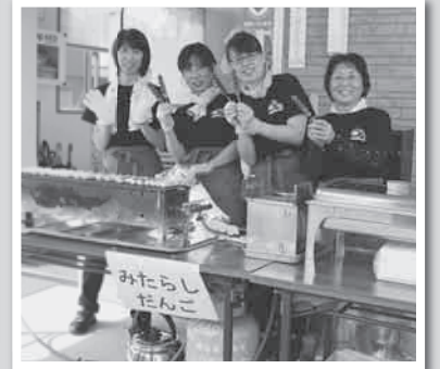
みたらし団子400本用意し、全部売り切れ!