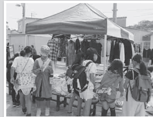
バザー 何かいいものないかな?