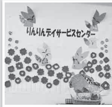
デイサービスセンターの作品