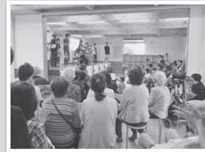
子どもたちと一緒に