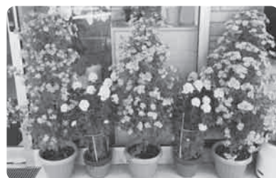
毎年、見事な菊を持ってきていただいています!

12月7日(木) りんりんデイサービスセンターで岩滑小のぞみ学級の子どもたちがクリスマス発表会をしました。