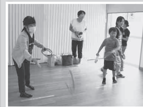
輪投げにはしゃぐ子ら