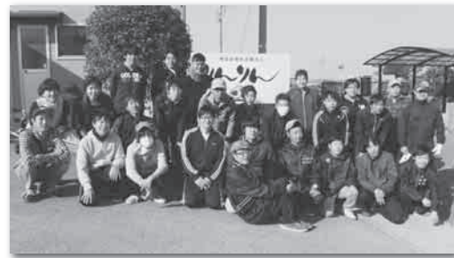
豊田自動織機の皆さん

「東知多班長会ボランティア活動の受入ありがとうございました。今年も2回のボランティアの機会を頂き、大変感謝しております。