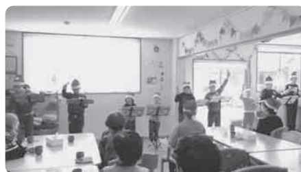
岩滑小のぞみ学級の子どもたち