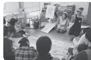
クリスマス会(日福大保育実習生)

12月7日(木) りんりんデイサービスセンターで岩滑小のぞみ学級の子どもたちがクリスマス発表会をしました。