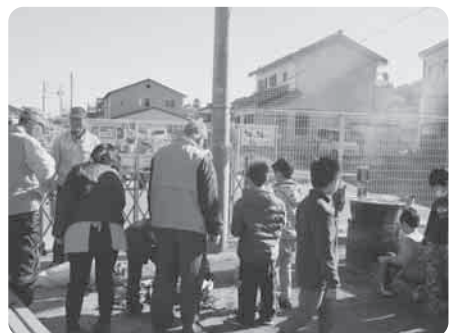
やなべお助け隊と炊き出し