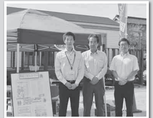
東海ろうきんコーナーで保険の相談