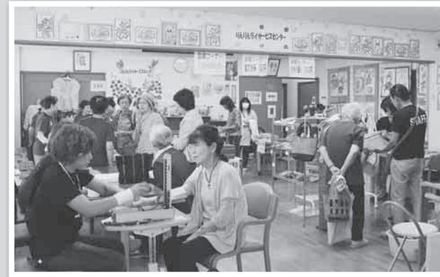
血圧測定・ハンドマッサージ