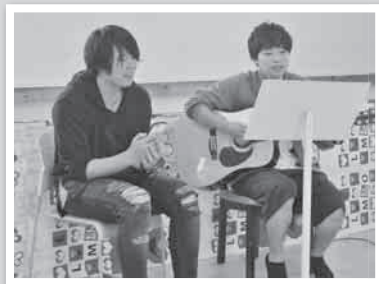
若い力強い歌声の 日福大軽音楽部の二人