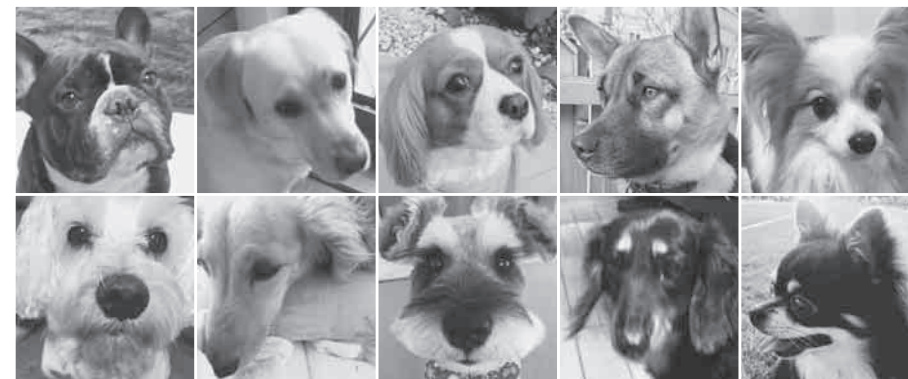
ワンだふるな年になりますように🐾