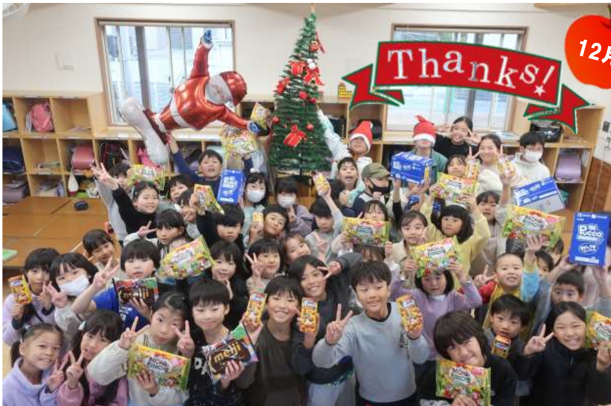
明治ホールディングス（株）株主様からのご寄付でクリスマスのおやつをみんなでいただきました☆シ