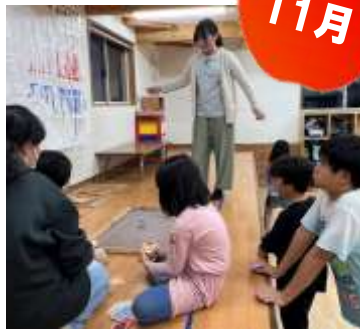
11月からコマけん玉検定が始まりました。各々目標に向けて頑張っています。