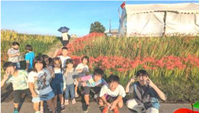
ごんの秋まつりに合わせて矢勝川へゴミ拾いに行きました。