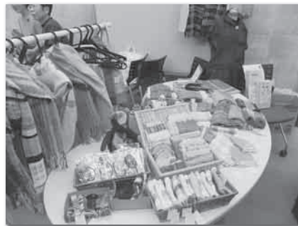
さをり織り・手づくり小物