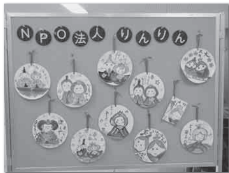
絵てがみのおひなさま