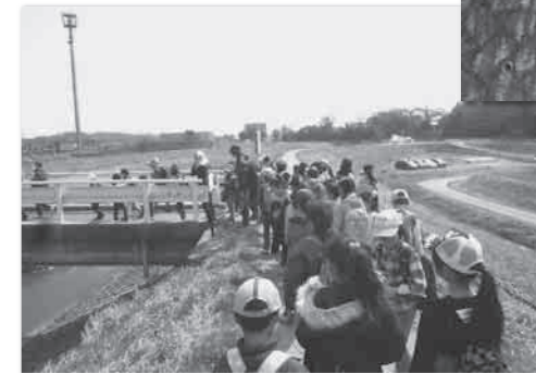
ガンバって歩こう